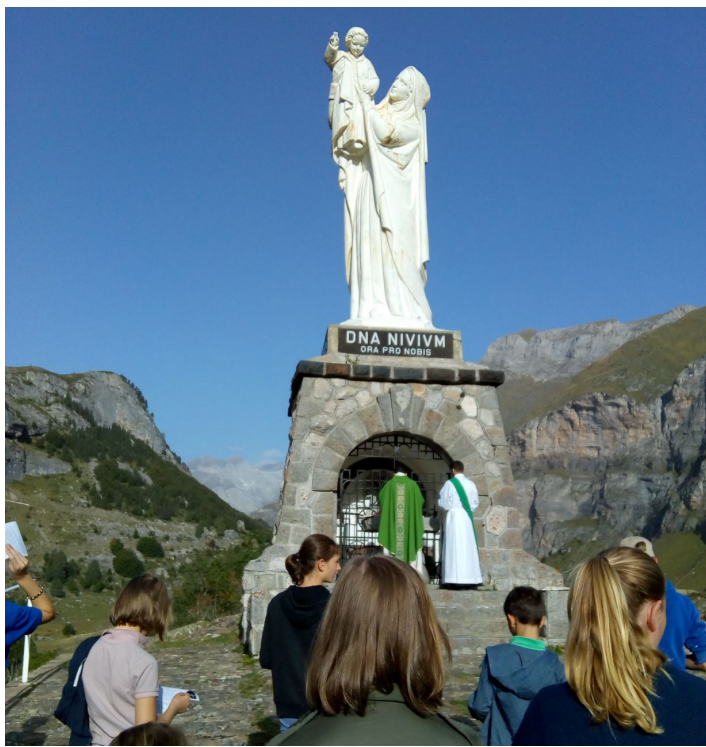
A l'école de Notre Dame, "reflet de la lumière éternelle"